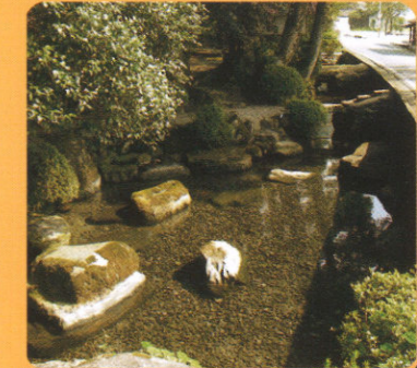
鳥取県指定 因伯の名水 布勢の清水

この清水がいつ頃から湧き出たのかわかっていませんが、「八幡さんの清水」とも呼ばれ、豊富な水量と良質清冷をもって近郷に広く知られております。