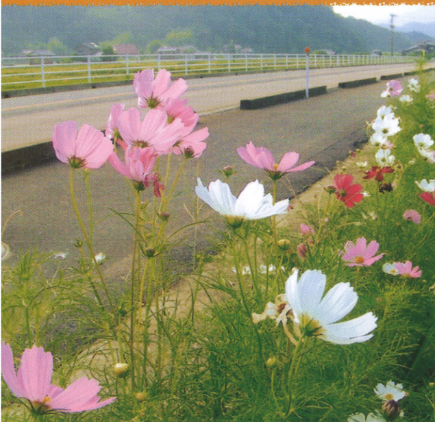
「コスモス」：県道沿いのコスモス!! 秋には可憐な花が咲き、まさに秋の桜そのものです。