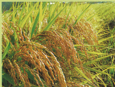
「黄金の稲穂」：赤トンボの飛び交う黄金の稲穂。実りの秋の象徴です。

コスモス街道を通り、たわわに実った黄金の稲穂の道を下れば、秋風が肌(頬)に心地よい。ふと足を止め振り返ると鷺が羽根を拡げたような鷺峰山の雄大な姿に心安らぐ。白壁土蔵を横目に見ながら中原名人の記念碑まで一気にウォーキング! あ~もうゴールだ!