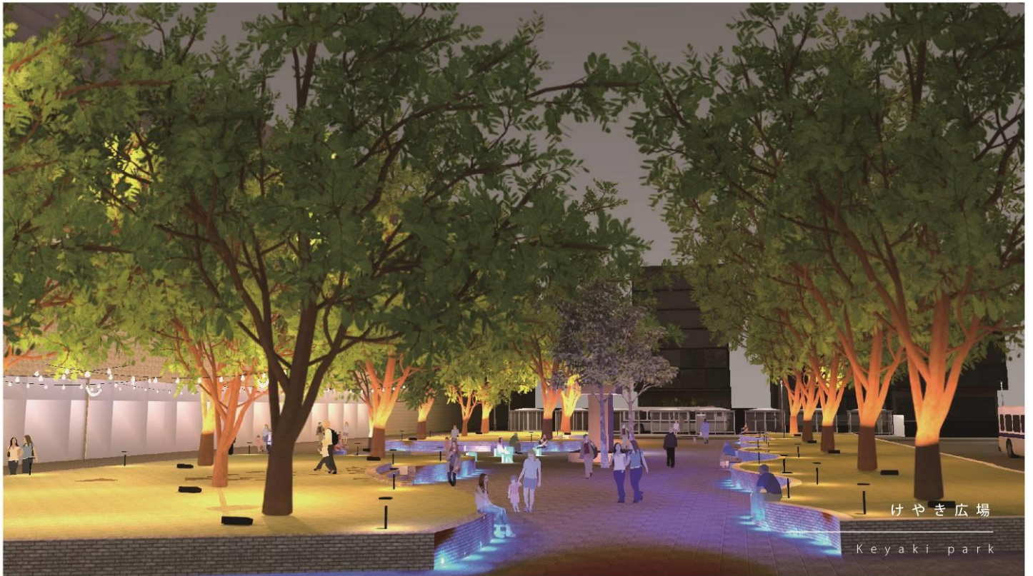
鳥取駅北口ケヤキ広場