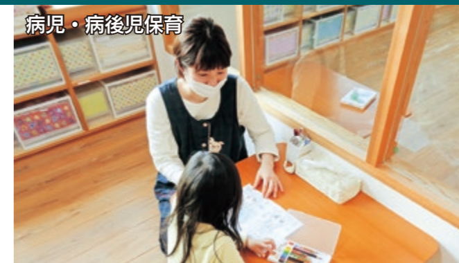
病児・病後児保育