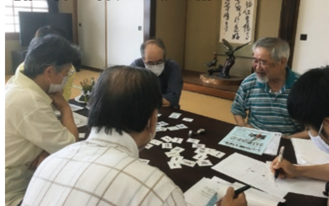
福祉の向上に向けた地域での話し合い