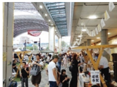
◀市道駅前太平線のにぎわい空間活用