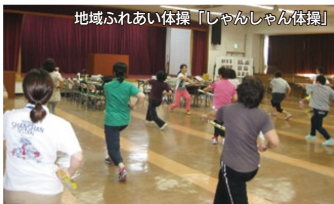
地域ふれあい体操「しゃんしゃん体操」

重点施策 スポーツ・レクリエーションの振興、健康づくり・疾病予防・介護予防の推進