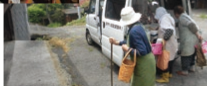
▶中山間地域での移動販売

重点施策 生活基盤の充実、中心市街地の活性化、魅力ある中山間地域の振興、交通ネットワークの充実、地域情報化の推進