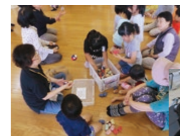
◀児童と地域住民による昔遊び体験