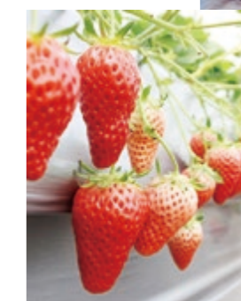
◀次世代型施設園芸による新たな産地づくり