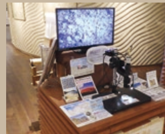
鳥取砂丘だけでなく、世界各地の砂を顕微鏡で見ることができます。