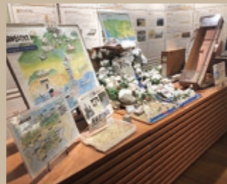
砂丘の成り立ちや砂粒の大きさ、手作りわかりやすく展示しています。