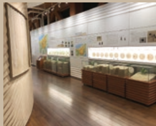
砂丘の植物や昆虫を展示。普段見られない植物の根や、虫の巣穴の構造も見られます。