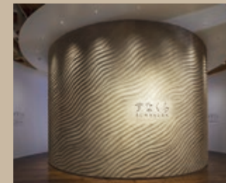
ドームシアター「すなくら」では、1年を通して撮影された砂丘の迫力ある映像を上映。