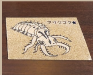
館内で手軽に体験できる「砂絵」は、ポストカードとして投函することもできます。

だれでも無料で楽しめる砂丘の魅力発信施設！ 鳥取砂丘はどうやってできたの？鳥取砂丘のおすすめの歩き方は？そんな疑問に答えてくれるのが、鳥取砂丘駐車場内に構える「山陰海岸国立公園鳥取砂丘ビジターセンター」です。 鳥取砂丘ビジターセンターには、砂丘の成り立ちや生息する動物、砂丘と人との関わりなど、砂丘の魅力を余すところなく伝える展示が満載です。 また、ガイドが展示を分かりやすく解説してくれる館内ツアー（無料）や、砂丘内を一緒に歩いて案内してくれる砂丘散策ツアー（有料）などがあり、初めて訪れる人だけでなく、これまで砂丘を訪れたことがある人でも、違った角度から砂丘を知り、改めてその魅力に気づかせてくれる施設です。 そのほか、砂丘専用車いすの貸出し（無料）や、休憩スペース、足洗い場も備えるなど、砂丘を心おきなく楽しむためのお手伝いをしてくれます。年間を通してさまざまなイベントも行っていますので、ぜひお立ち寄りください！