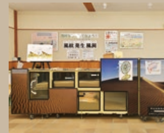
世界に一つの風紋発生実験装置を使って、風紋のでき方をわかりやすく説明します。