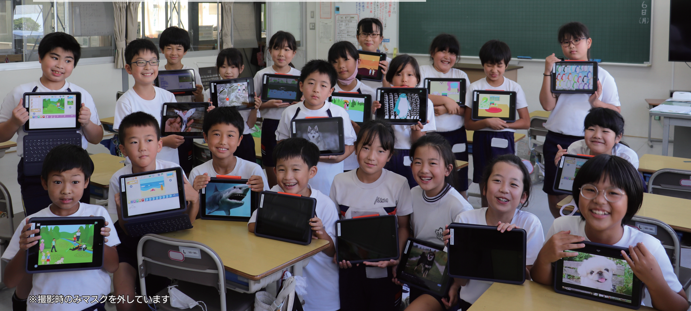
※撮影時のみマスクを外しています

問 本庁舎学校教育課 ☎ 0857-30-8412 ☎ 0857-20-3952