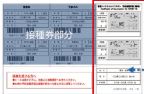
①新型コロナウイルスワクチン予防接種済証

接種済証を紛失した場合は、申請により再発行が可能です。本市公式ホームページから必要書類をご確認いただき、持参または郵送で申請してください。