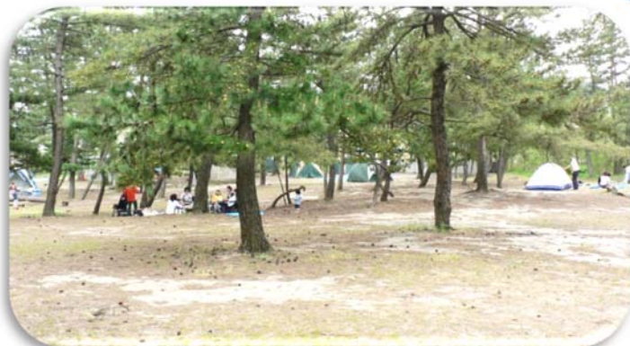
②柳茶屋キャンプ場