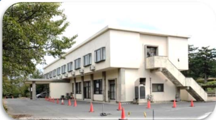
①サイクリングターミナル