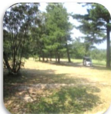
③こどもの国キャンプ場