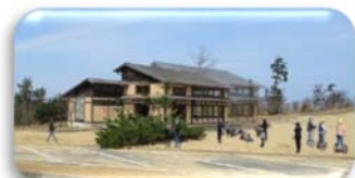
④デジタルセンター西側施設・休憩舎