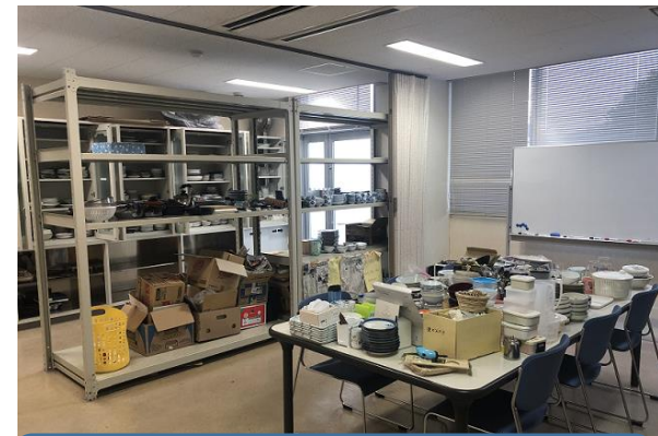
提供用のリサイクル日用品