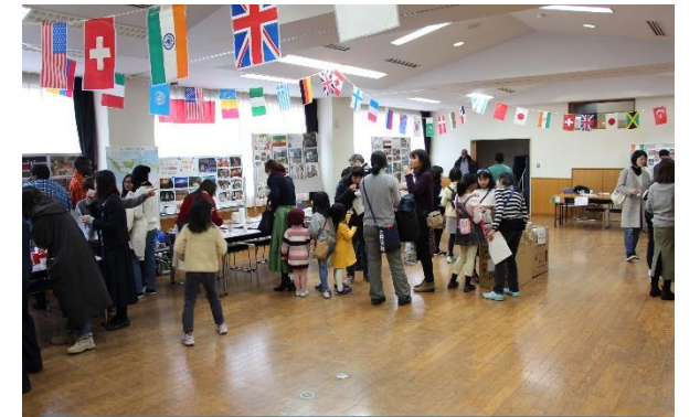
多文化交流フェスタ