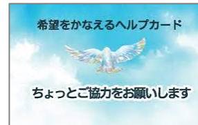
（日本認知症本人ワーキンググループ作成）