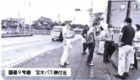
国道9号線 宝木/大伊付近

8月24日(火)、気高町内で令和3年度の通学路合同安全点検が実施されました。鳥取市では、子どもたちが安心して学校に通学できるように、学校を通して要望があった箇所を点検し対策を検討しています。今年度は、浜村小学校、瑞穂小学校、宝木小学校からそれぞれ要望が提出されました。