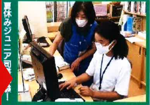
夏休みジュニアアワード

国府町町屋地内/7月17日(土) 因幡万葉歴史館で、「日本遺産・麒麟獅子舞体験体感プログラム」が開催されました。これは、普賢神社の祭礼で見られることのできない麒麟獅子舞を、より多くの人に体験してもらおうと実施したもので、およそ50人が訪れました。「因幡麒麟獅子舞の会」による迫力ある舞や、舞に使われるかねや太鼓の体験コーナーがあり、参加者からは「自分の太鼓に合わせて獅子舞が舞ってくれたので感動