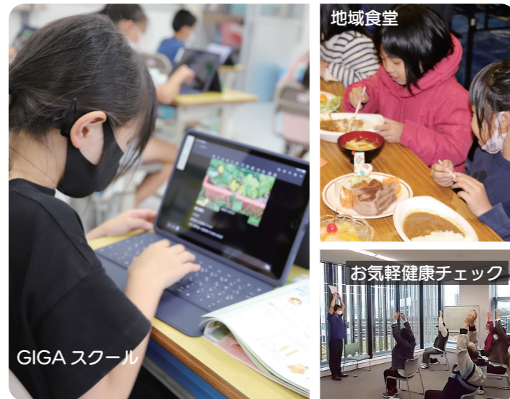
※1：児童・生徒に一人一台のコンピュータと高速ネットワークを整備する取り組み ※2：持続可能な世界を実現するために2030年までに達成すべき17の目標