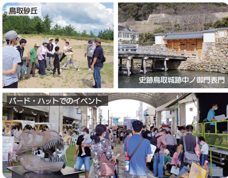
※5：人工知能や情報通信技術、ロボットなどの先端技術 ※6：「歩くことができる、歩きやすい」という意味の形容詞