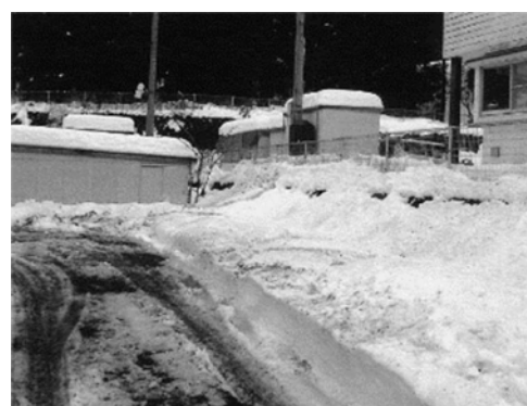
事故のあった場所