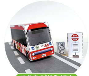
できあがりみほん