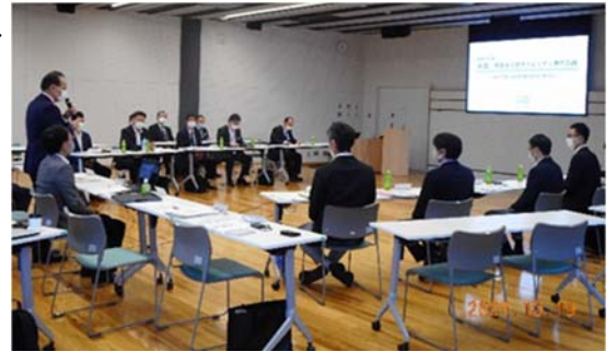
第1回鳥取市次世代モビリティ推進会議の様子

■本市でも、運転手の人材不足を理由に公共交通の事業縮小が続く中、令和3年10月に「鳥取市次世代モビリティ推進会議」を発足し、自動運転に関する取組を本格的にスタートしました。