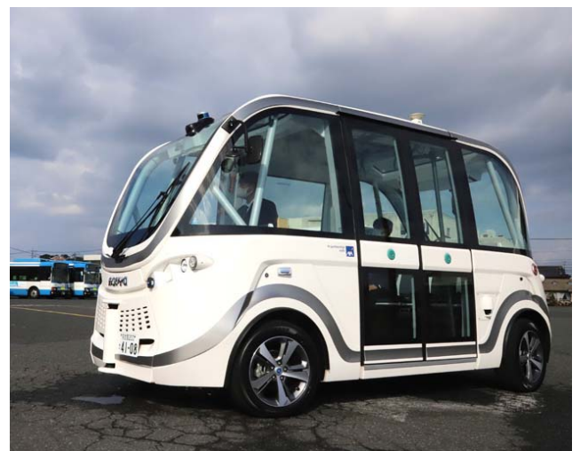
図2: フランス Navya(ナビヤ)社の車両