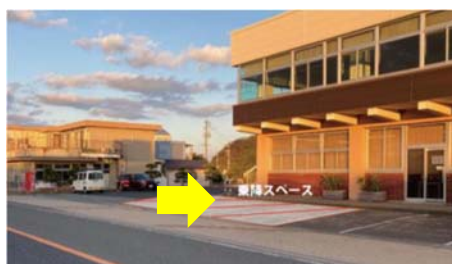
乗降場所(会館前駐車場)