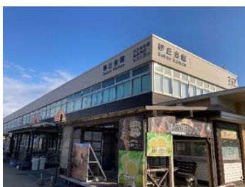
鳥取砂丘会館外観