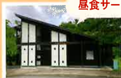
上野ふれあい交流館