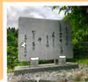
因幡国守・在原行平の歌碑