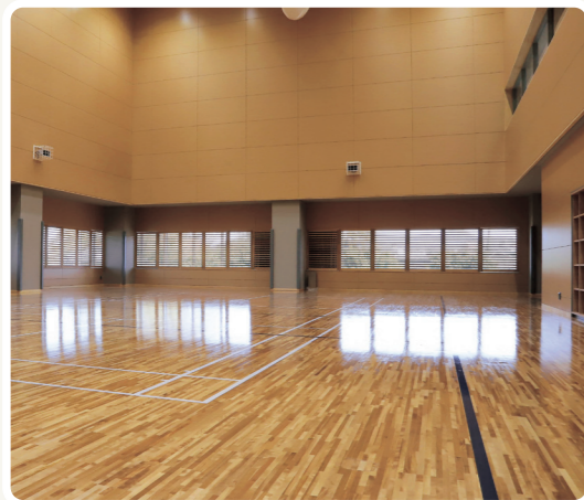
広さ：368㎡(バレーボールコート1面分) ※公式試合での使用は不可

災害時の避難所としても 体育館の近くには、過去に水害が発生したことがある大路川があることから、メインアリーナなどの主要施設を浸水しない2階部分に設けました。そのほかにも、国道53号線から直接施設へ出入りできるスロープや防災備蓄倉庫を設け、災害時に避難所として活用できる施設としています。