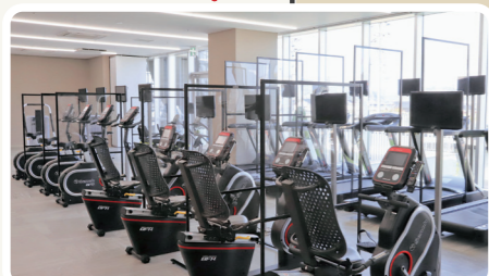
軽い運動から本格的な筋力トレーニングができる最新の機器を配備しています