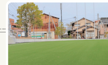
子どもの遊び場、マルシェなどイベント会場として利用できます