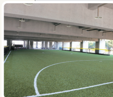
クッション性があり、維持管理の負担も軽減できる人工芝を敷いています