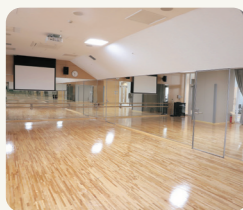
プロジェクトを備え、多目的な研修に利用できます