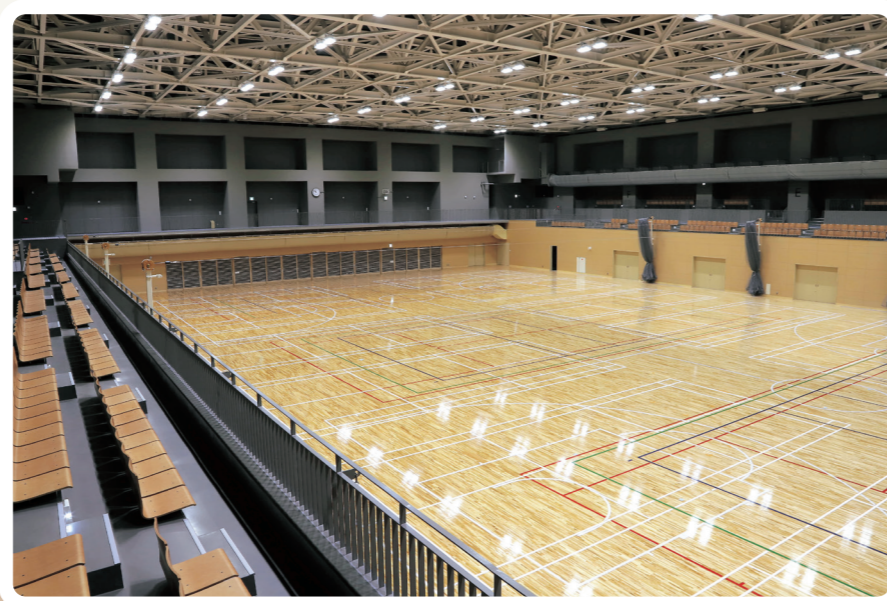
広さ：2,147㎡(バレーボールコート3面分) 観客席：472席 (車いす用観覧スペース4席)