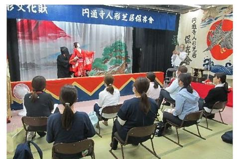
6/15(木) 人権と福祉のまちづくり講座