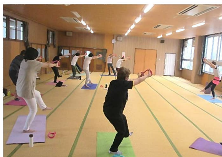
6/2(金) 健康づくり教室