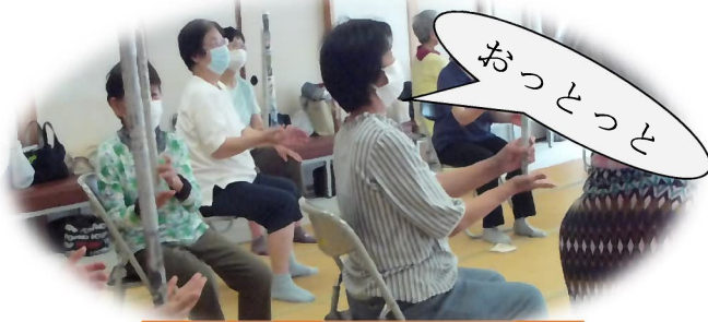
フレイル予防教室 (6.29)