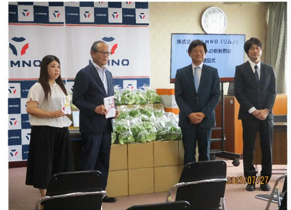
提供された新鮮野菜を囲んで

「株式会社LIMNO」(旧:三洋テクノソリューションズ鳥取株式会社)様が、新施設を立ち上げられ、その施設で生産された新鮮野菜を提供くださいました。今後も毎月継続されます。