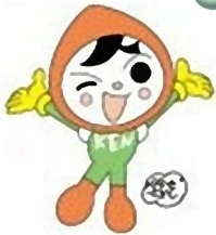
人権イメージキャラクター 人KENももる君

児童福祉週間は、こどもや家庭、こどもの健やかな成長について国民全体で考えることを目的に、定められています。