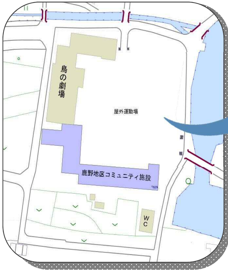
<現在の旧鹿野小学校周辺図>