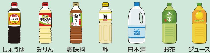
しょうゆ みりん 調味料 酢 日本酒 お茶 ジュース

※PETマークの有無にかかわらず、下記の容器はプラスチックごみに出してください。