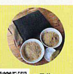
ご予約 LINE公式 アカウント

西洋医学を学ぶ中、仙人鍼灸師に出逢う。東洋医学・東洋思想に惹かれ、鍼灸を学ぶ。修行の時を経て、今、鳥取で鍼灸治療院開業中。