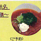
(ご予約) イヌイ薬局 (0857-53-5805)