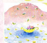
鍼灸 水花月~mikatsuki~ 講師：小松 真苗