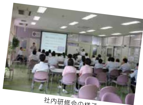
社内研修会の様子