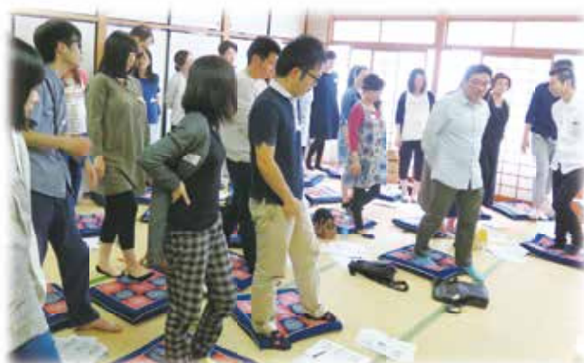
今年度に開催した輝なんせ鳥取講座の様子（関連記事 4 頁）