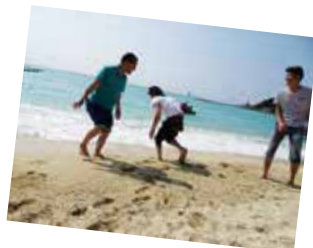
毎年行う社員旅行の様子