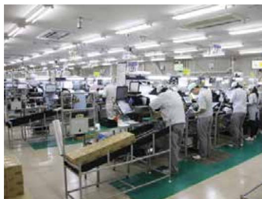
LED照明組立ライン作業風景