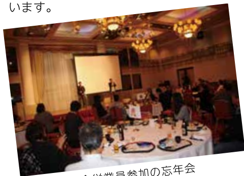
全従業員参加の忘年会

その他にも、毎年実施している全従業員参加のビアガーデンや忘年会は、バリアフリーの会場で実施するなど、性別や障がいの有無に関わらず、全ての従業員が働きやすい環境づくりを心がけています。