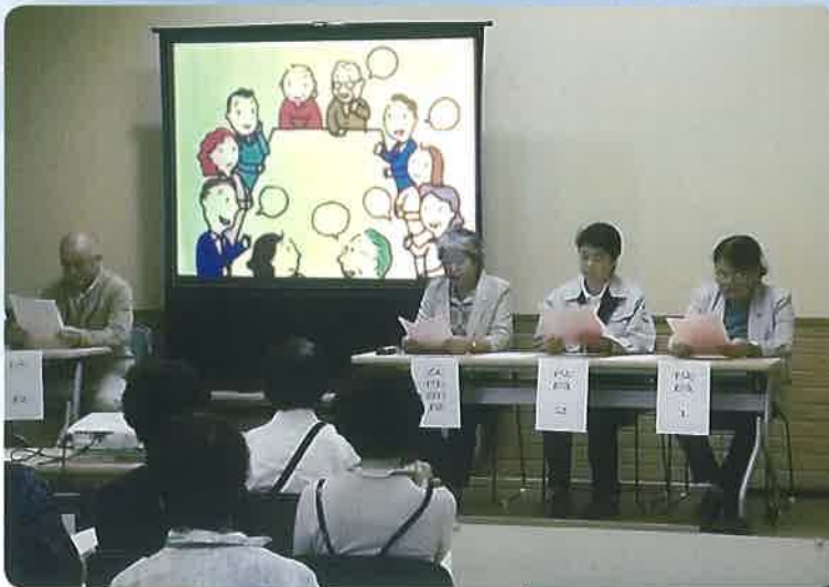
朗読劇: 男女共同参画推進会議とっとり