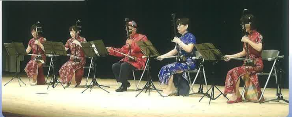
オープニング: 胡桃の会 (二胡の演奏)