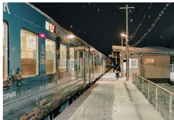
@cyama0226さん「雪の日の無人駅」