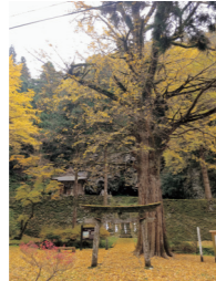
子守神社(青谷町八葉寺)