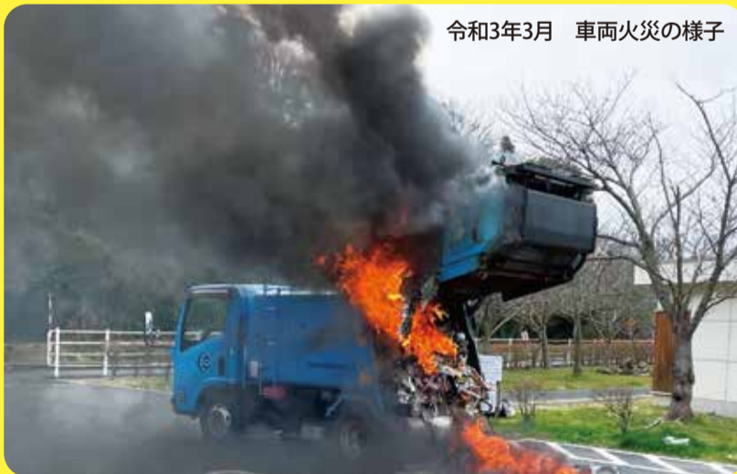
令和3年3月 車両火災の様子

家庭ごみの処理施設でリチウムイオン電池が原因と思われる大きな火災が2件、収集時のガスボンベが原因と思われる車両火災が2件起きています。不燃ごみを処理している鳥取県東部環境クリーンセンターでは、小型破碎ごみの処理中に確認した発火件数(令和4年度実績)は、年間117件です。そのうちリチウムイオン電池が原因の発火は56件で、稼働日の2~3日に1度は発火を確認しています。