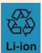
リチウムイオン電池