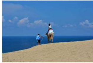
【1泊2日】鳥取砂丘&定番観光！翌日は鳥取土産もGet！関西からの定番コース

関西方面から鳥取の観光地へ来て、鳥取市の定番観光地「砂丘」へ！ 鳥取・鳥取市からの、はじめての鳥取観光にぴったりの定番コースをご紹介します。 ●所要時間：2泊3日 ●料金：お問い合わせ