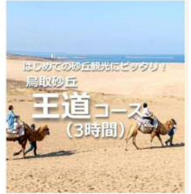
【3時間】鳥取砂丘王道モデルコース

関西方面から鳥取の観光地へ来て、鳥取市の定番観光地「砂丘」へ！ 鳥取・鳥取市からの、はじめての鳥取観光にぴったりの定番コースをご紹介します。 ●所要時間：2泊3日 ●料金：お問い合わせ