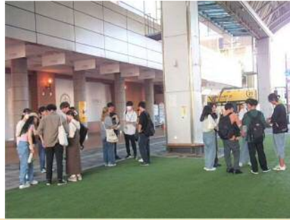
明治大学の学生との交流