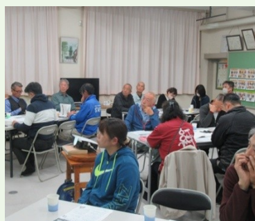
青谷町ひおき地域づくりゼミ