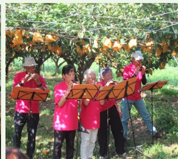
八頭町麒麟のまちコンサート