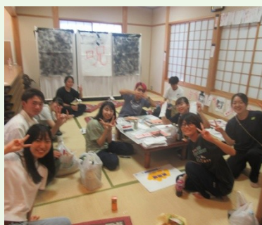
岩倉のお化け屋敷と散岐スポーツフェスにばばのばプロジェクトが協力