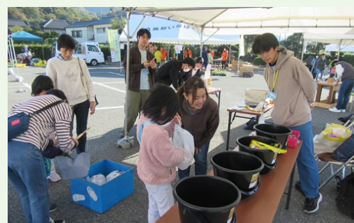
ふくべ公民館まつりにトリセフが協力

今年度も鳥取大学の学生の皆さんに地域と関わっていただきました。その取り組みについて発表します。