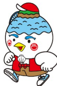
湖山池マスコット 「こいけちゃん」