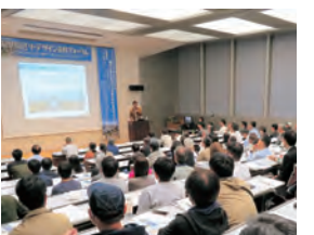
前回の市民フォーラム