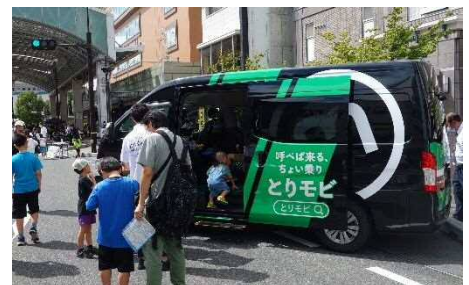
交通イベントでの車両展示