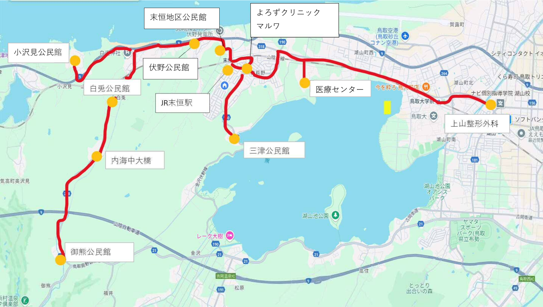
NPO法人OMU 現在の運行ルート図