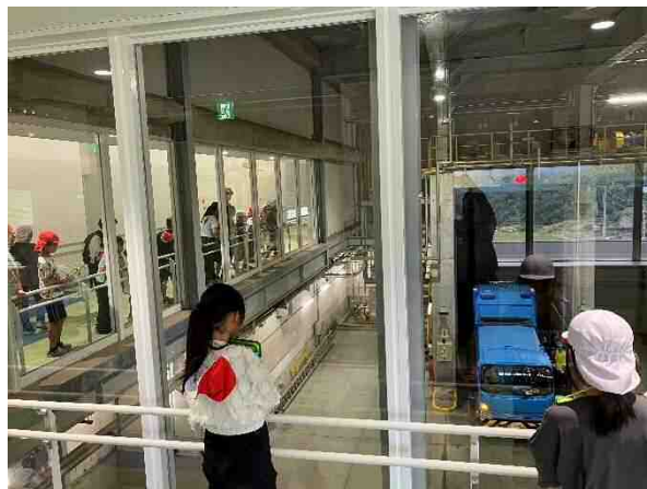
岩美北小学校・リンピアいなば見学