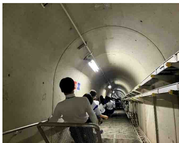
岩美中学校・殿ダム監査廊見学