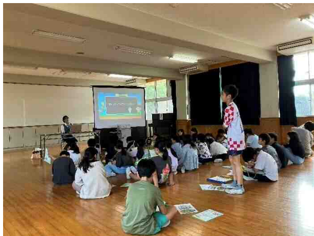
岩美北小学校・座学