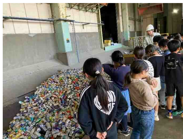
若葉台小学校・リファレンいなば見学