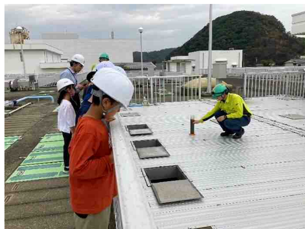
散岐小学校・秋里下水処理場見学