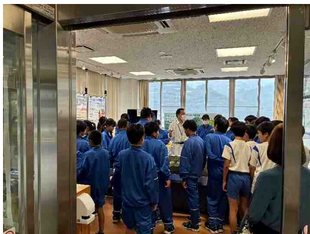
岩美中学校・殿ダム説明