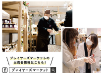
プレイヤーズマーケットの出店者情報はこちら！ プレイヤーズマーケット

渡世さんは「売場の店舗が感じること、対面販売の良さも改めて感じています。出店者さんそれぞれが誰にだって輝いてほしいです。お客様もワクワクしてもらえ空間に、もっともっとしていきたいです。と目を輝かせています。