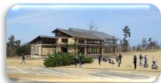
④デジタルセンター西側施設・休憩舎