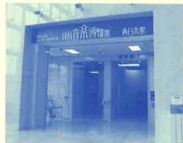
民音音楽博物館 西日本館