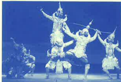
マリンロード音楽の旅<1>(1984年)