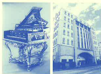
古典ピアノ 民音音楽博物館 (シュトローム・1793年製) (民音文化センター内)