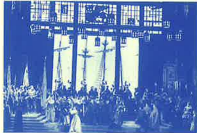
ミラノ・スカラ座(1981年)