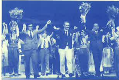
シルクロード音楽の旅<4>(1985年)