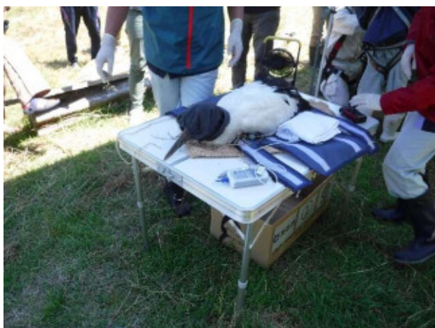
捕獲したヒナの血液等を採取