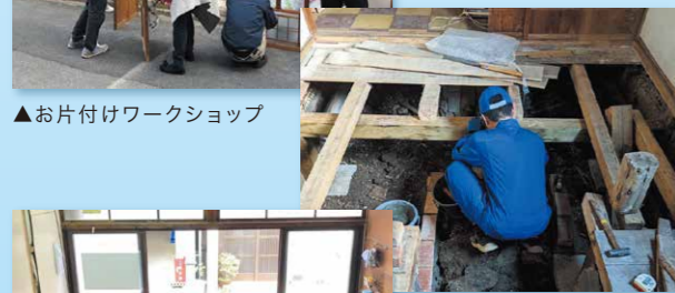
▲お片付けワークショップ