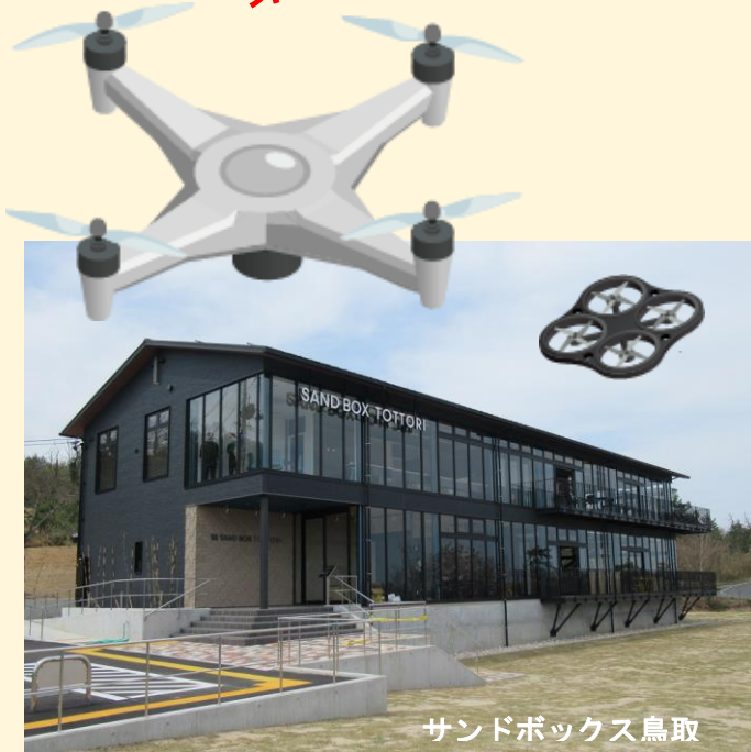
サンドボックス鳥取

テーマに関心のある地域のリーダーの皆さん、地域の活性化に関心のある方などに参加していただきますようご案内申し上げます。