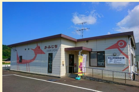
青谷上寺地遺跡展示館